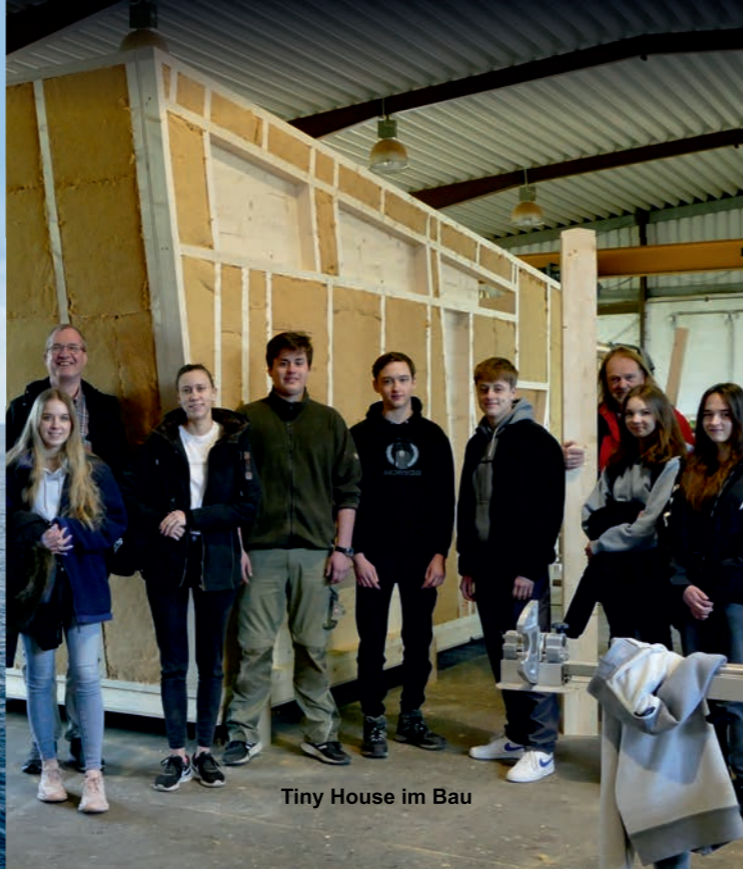
Tiny House im Bau